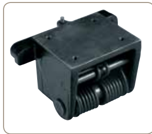
Ideal auf Tischfräsen zum einfachen Abklappen des Vorschubes (Option)